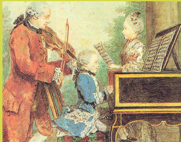
(L. Carmonetelle: Leopold Mozart und seine Kinder)